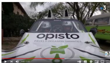
Reportage France 3 01/01/21

Revivez la course en images et en vidéos : Instagram , Facebook , YouTube , Twitter , LinkedIn