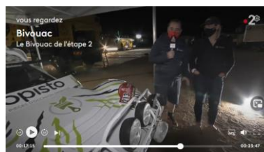
Emission Bivouac France 2 05/01/21 (à partir de 16min55)